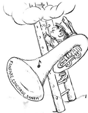
"DIE HIMMELSLEITER - ET GÄT ÖMMER ME' HECH. -

1953 gouf d'Kierch vu Grond op renovéiert. A si war - an den Ae vum "Peckvillche" - ganz houfereg doriwer.