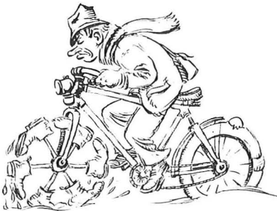
HEI ASS AN DEN AM WAUNTER DE LENTZ NÖT WOLLT HUELEN -

Hei gin elo di eenzel Szene, der Rei no - wéi se op der Plackat sinn - gewiesen an explizéiert: am Ganze sinn et der 11 - et goufen der 8 ausgewielt. Si dokumentéieren enger-säits dem "Peckvillche" säi Stil, sinn awer och de Spigel vun deem, wat viru 50 Joer zu Suessem lass war.