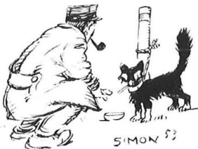
DE KANTUNJÉ VUN ZOLVER HÄLT OP ECHT KATZENAUGEN" OP DER SUESSEMER LAUNDSTROSS

War dat heien d'Gebuert vun der Ëmweltbewegung? Op alle Fall war et e Protest dergéint, dass deemools, a kurzer Zeit, direkt drei Bescher ronderëm Suessem ëmgehae goufen: den "Hânebösch", de "Sche'nk a Gro'ssebösch" an de "Scheierbösch".