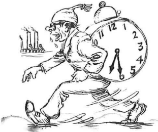
DE LENTZ ASS FORT....