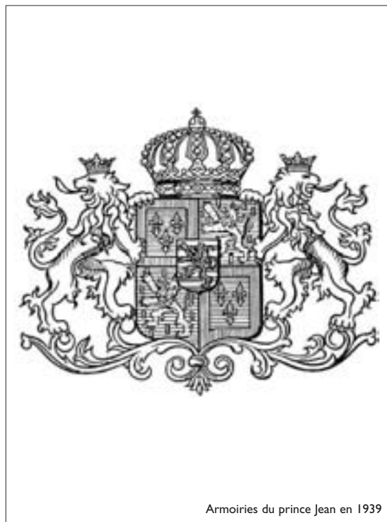
Armoiries du prince Jean en 1939

Écartelé aux I et IV d'azur à trois fleurs de lis d'or, posées 2,1, à la bordure de gueules (Bourbon-Parme) ; aux II et III d'azur semé de billettes d'or, au lion couronné d'or, armé et lampassé de gueules, brochant (Nassau) ; sur le tout en cœur un burelé d'argent et