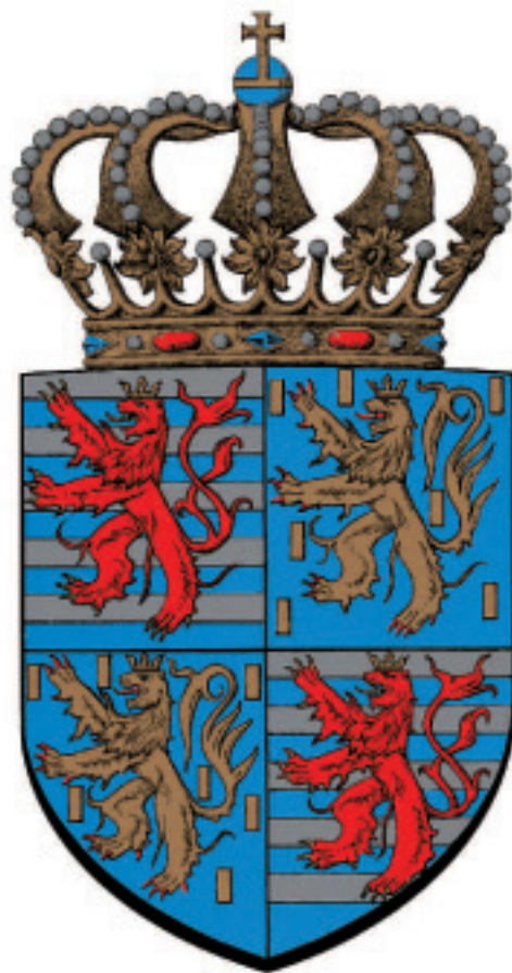
Petites armoiries de S.A.R. le Grand-Duc Henri de Luxembourg

Écartelé, aux I et IV de Luxembourg qui est un burelé d'argent et d'azur, au lion de gueules, la queue fourchue