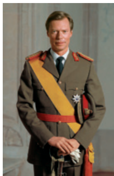
S.A.R. le Grand-Duc

Son fils Guillaume IV, Grand-Duc de Luxembourg (1852-1912) n'ayant que des filles, rédigea le 16 avril 1907 le statut de famille réglant la succession en ligne féminine. Ce statut obtint force de loi le 6 juillet 1907.