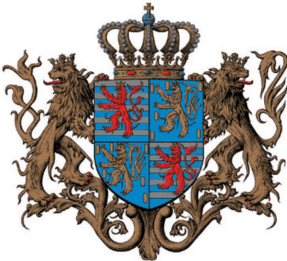
Moyennes armoiries de S.A.R. le Grand-Duc Henri de Luxembourg

Les grandes armoiries, rappelant les territoires dépendant de l'ancien duché de Nassau et annexés par la Prusse en 1866, n'avaient plus de rapport avec la réalité politique ; elles ne furent utilisées par le Grand-Duc Jean que sur son grand sceau.