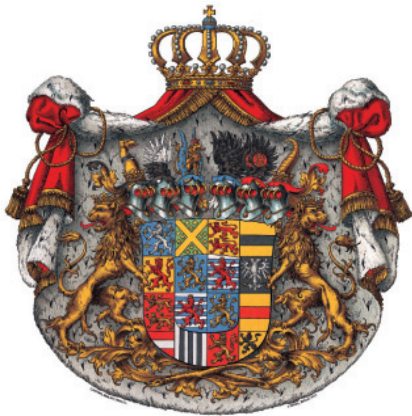
Armes composées en 1898 pour S.A.R. le Grand-Duc Adolphe de Nassau